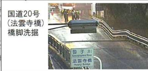
国道20号 (法雲寺橋) 橋脚洗掘