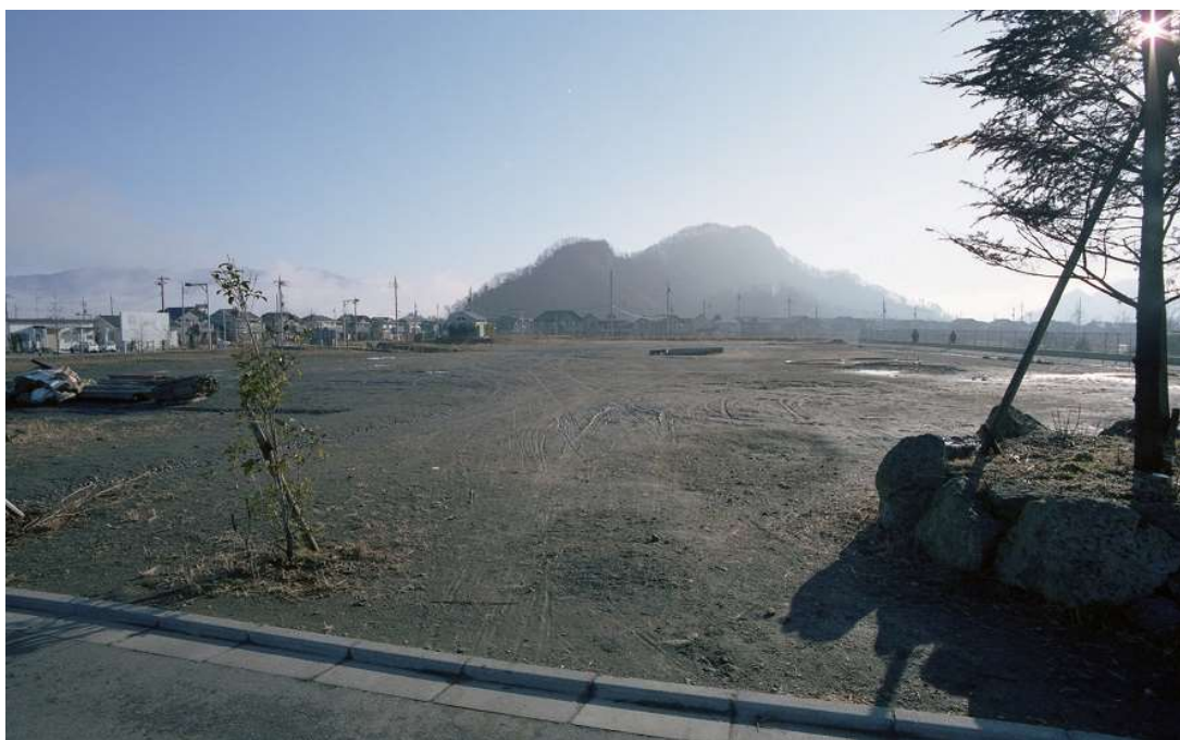
「1995 年早春の朝 後のコモアブリッジ上部ステーション前広場付近から、御前山を望む」