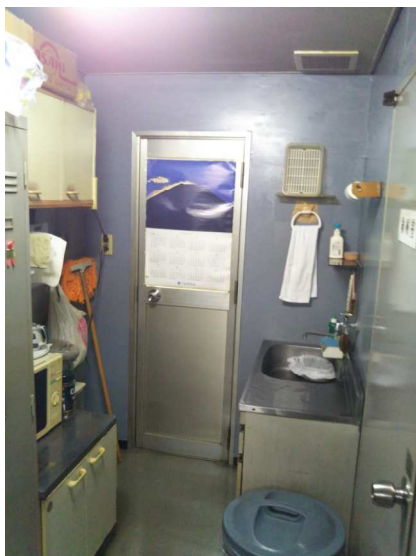
◎トイレ及び流し台