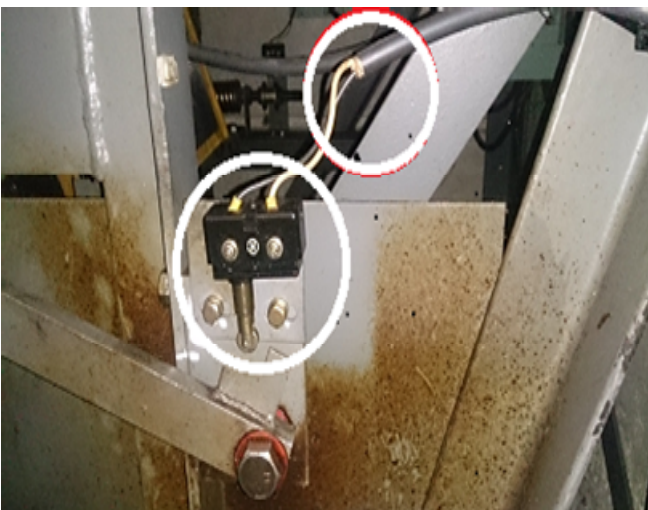
安全装置と配線ケーブル