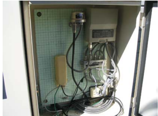
【保安器箱内】 (交換後のブースターと保安器)