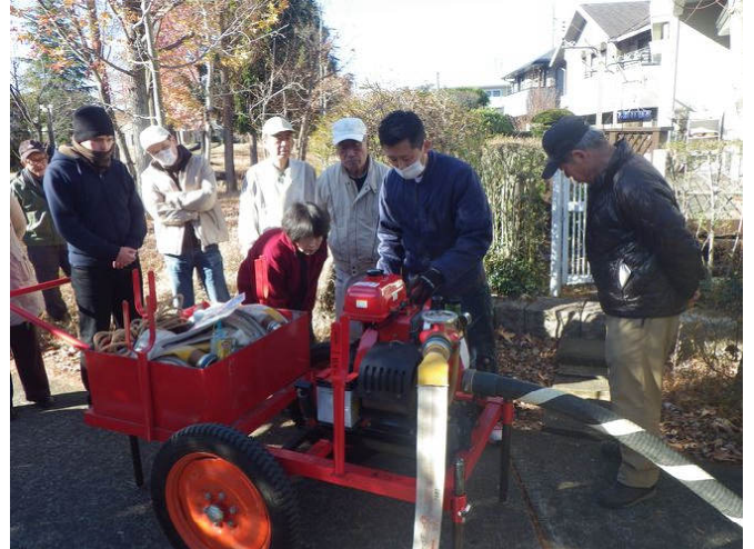
エンジンのかけ方を学ぶ住民