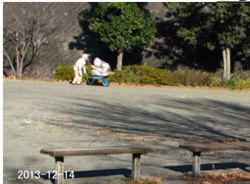
スポーツの公園を清掃する人