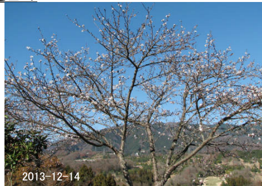
1丁目北側で春を待つ桜の花