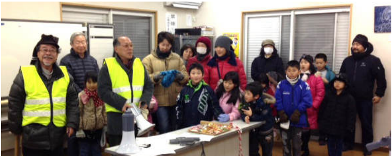
出発前に集会所で会長あいさつ

8時から30分、3丁目の集会所でお茶菓子などをつまみながら、お疲れ様会を行い、無事終了となりました。