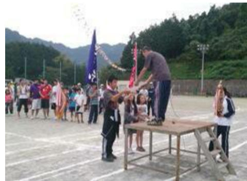
コモア地区の表彰