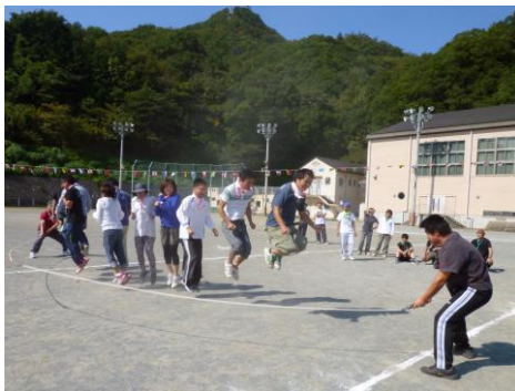
コモア選手による縄跳び

ご参加いただいた皆さん、お手伝いいただいた皆さん、本当にお疲れさまでした。 来年も、ぜひ多数のご参加をよろしく願いいたします。