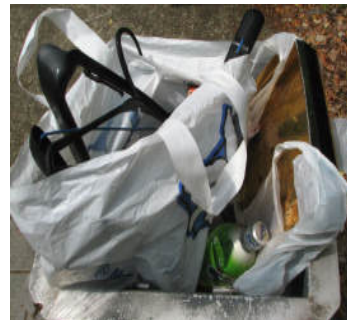
「時計の公園」東側のゴミ箱