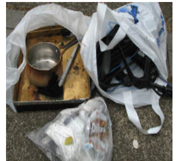
金属、ハンガー、幼児下着