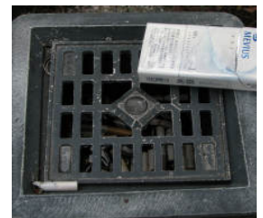
石の公園寄りにある2つの灰皿