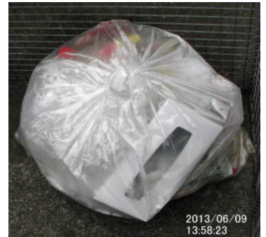
出ていた可燃ゴミ