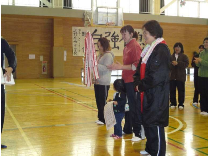
<ソフトバレーボール>