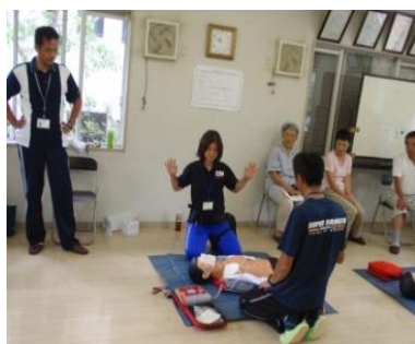
講師による模範演技