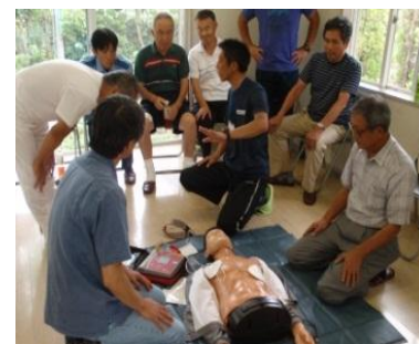
AEDの パッドを貼る時は・・・