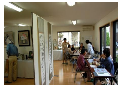
（写真は平成20年度の様子です）