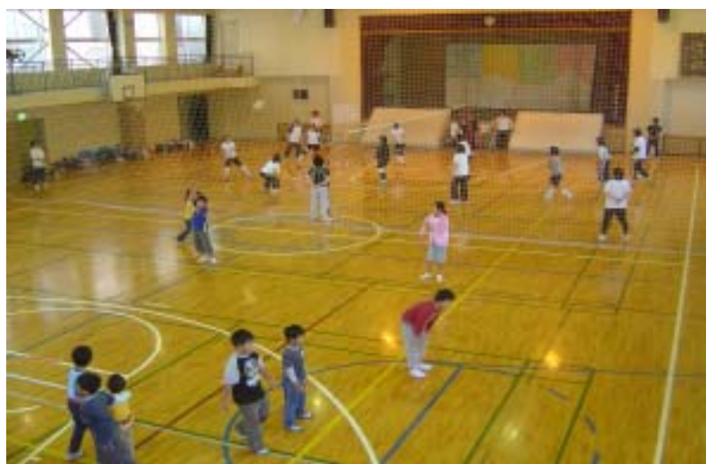
ドッジボール競技風景