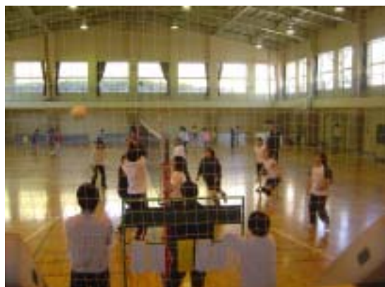
ソフトバレーボール競技風景