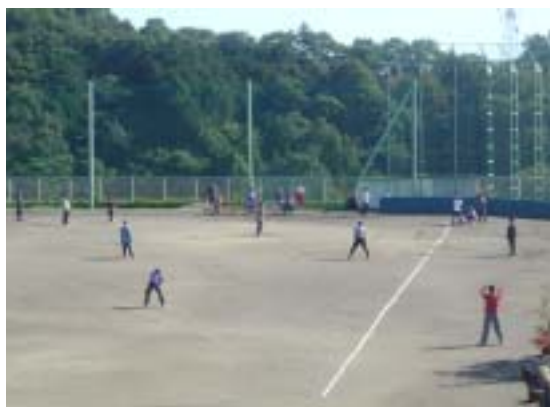
ソフトボール競技風景