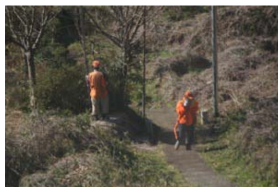
イノシシを探す上野原猟友会のみなさん

出没情報が集中している「スポーツ公園」下の草むらを中心に“捜索”、2頭のイノシシを発見し仕留めました。同地点は四方津中や巖中の通学路の脇で四方津駅方面への通勤ルートでもあることから、この作戦が成功で“大事”に至らず解決しとりあえず「良かった」と思いました。コモアからは防犯連絡所の防犯指導員5人がスポーツ公園に通ずる道路の交通規制などにあたりました。