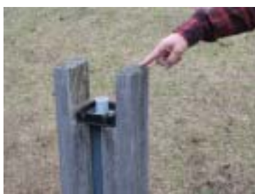
時計の公園グローブ・電球