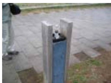
緑道 グローブ破損