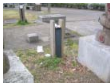
石の公園グローブ・電球